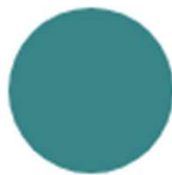
Modrá světlá (333)