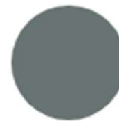
Šedá tmavá (695)